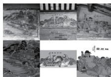
图1 在寨采村——数字壁画修复前后对比

创新青年参与模式是必然举措。可以探索“高校+乡村+企业”三方合作模式，发挥各自优势，推动数字技术在乡村的落地应用。建立青年创新创业孵化基地，为青年提供项目孵化、资金支持等服务。开展数字乡村建设竞赛，激发青年的创新活力。利用新媒体平台，宣传推广青年参与数字乡村建设的典型案例，营造良好氛围。图1、图2是广州华南商贸职业学院“三下乡”数字乡村暑期服务队参与数字乡村建设的案例分享。